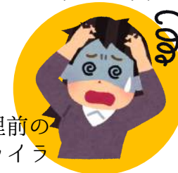
生理前のイライラ