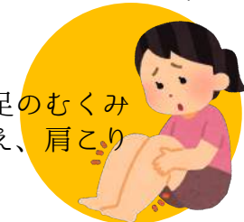
手足のむくみ 冷え、肩こり